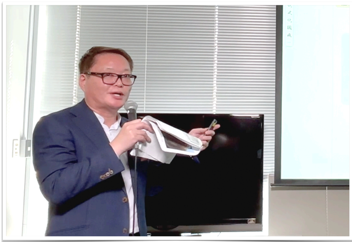
“国内ダントツ首位” 月間2000mlの幹細胞培養上清治療の臨床例や 大好評の「ED再生治療」の実態を土屋理事長が詳説