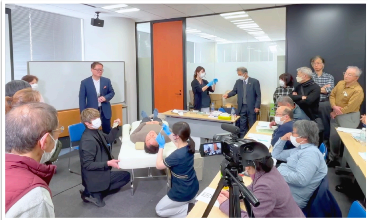
LIVE リアル再生治療体験タイム ① 培養上清エクソソーム点鼻実演指導