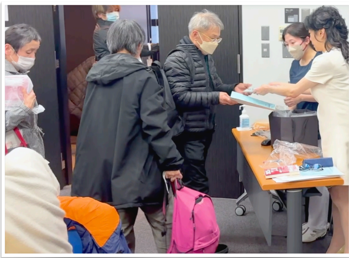
【閉会】 受講者全員に点鼻トライアルセットを贈呈