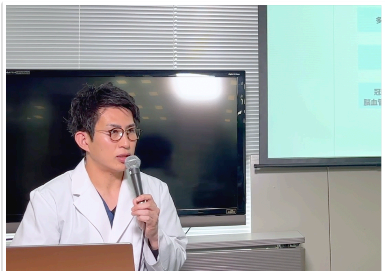
“日本人の死因No.1”動脈硬化症に対する幹細胞治療の効果、 糖尿病再生医療における国内屈指の豊富な臨床例を紹介する麻沼院長